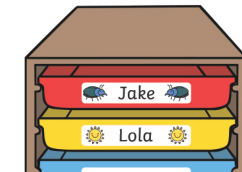
drawers les tiroirs