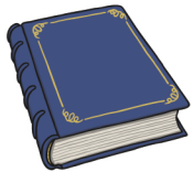
book le livre