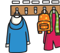
cloakroom la vestiaire