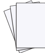
paper le papier