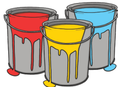
paints les peintures