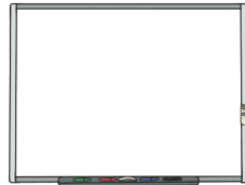
interactive whiteboard le tableau interactif