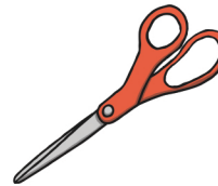
scissors les ciseaux