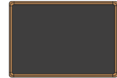
chalkboard le tableau noir