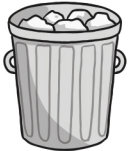
bin la poubelle